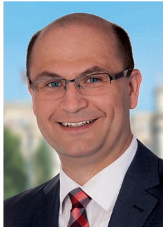
Dr. Markus Söder, MdL Staatsminister

A handwritten signature in blue ink, reading "Albert Füracker".